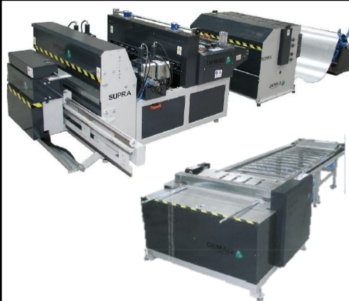
MAQUINARIA PARA FABRICACIÓN DE CONDUCTOS DE VENTILACIÓN

EL CONJUNTO DE FABRICACIÓN DE CONDUCTOS MDOELO SUPRA CONSTA DE TRES MÓDULOS: